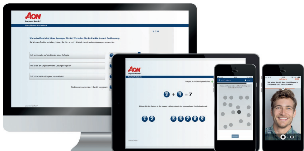
Screenshot: shapes basic, scales eq, gridChallenge und vidAssess

Die besten Talente entscheiden sich für Unternehmen, mit denen sie sich identifizieren können.